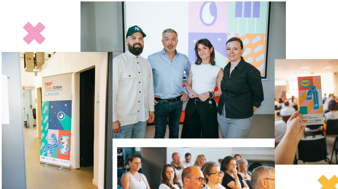
Atelier des projets

des questions, des échanges, des découvertes et une belle ambiance pour cette 1ère étape