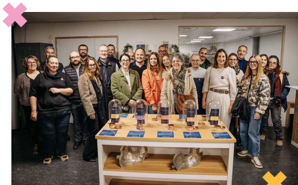
Soirée chez Néogourmets - déc. 2026